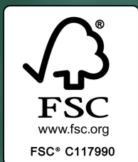
Vastuullisen metsänhoidon merkki

Yksilöidyt FSC-logot lisenssinhaltijoille*