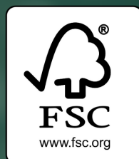
Vastuullisen metsänhoidon merkki FSC® C117990